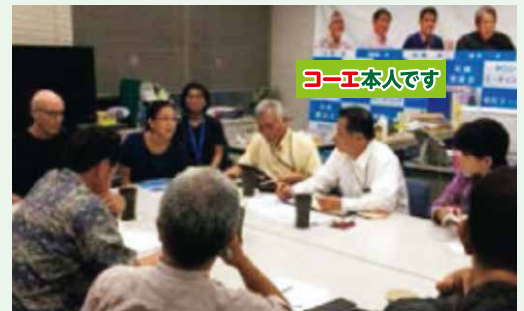
ミッチェル氏と米軍基地から発生する環境問題について議論