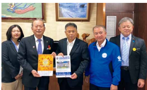
各地域首長への要請