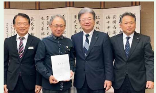
各団体・自治体からの陳情・要請支援