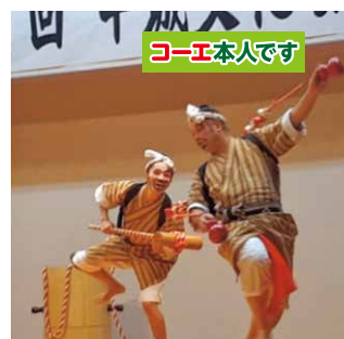
地域伝統文化の継承