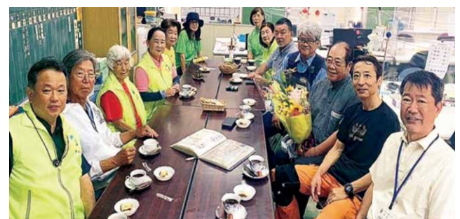
学校支援活動 (新報・タイム 23.6.8)