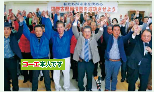
県民投票連絡会の三役として