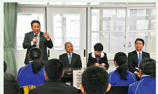
那覇高校で出前講座 主権者教育