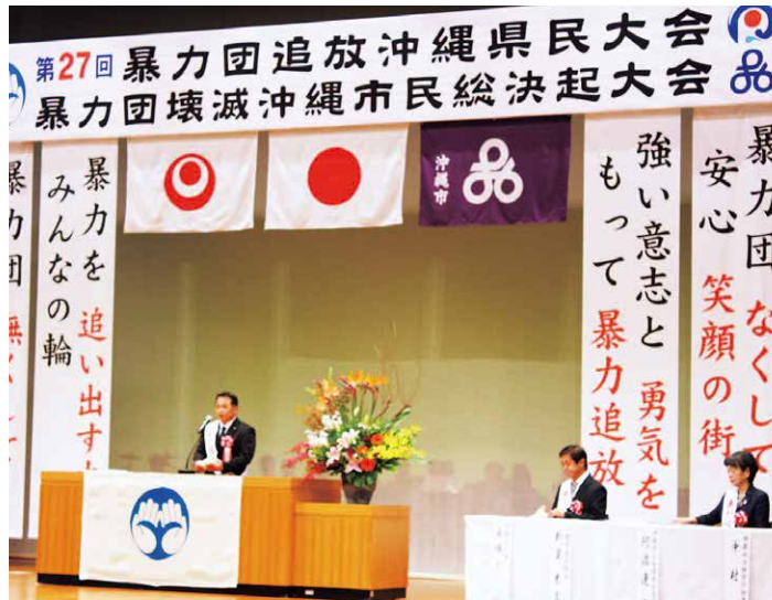
暴力団追放沖縄県民大会議会代表挨拶

コミュニティ助成事業や地域活性化助成事業などを通じて、自治会の自主的・自発的な活動等を支援しております。