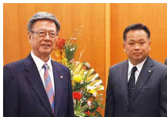
知事公舎（平成30年1月1日）

この大型M I C E施設は、沖縄の均衡ある発展を目指し、西高東低の不平等な沖縄の状況を打開しようということで、知事の肝いりで東海岸へ目を向けました。今までの沖縄の主要プロジェクトを見ても、ほとんどが西側です。東側の主要プロジェクトがない。その辺を県の職員も意識していただきたい。これからの有効的な土地活用がこの沖縄県の飛躍つながる、東側的那覇広域市街化調整区域も軍用地と一緒に可能性のある地域だと思っています。所見をお願いいたします。