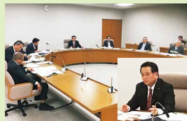
2月1日 議連県外視察 団長して(石川県・大阪府)