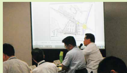
8月17日 沖縄県都市計画審議会