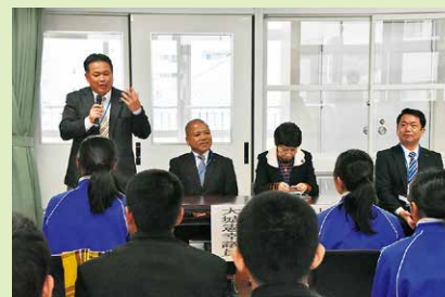
1月17日 那覇高校出前講座にて

第174回 那覇広域都市計画区域区分の変更「西普天間住宅地区」ほか4件について、都市計画に関する事項を調査審議しました。