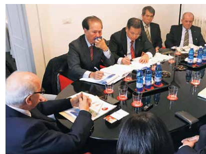
米軍との合意事項について（イタリア元首相と面談）

嘉手納飛行場においては、SACO合意の趣旨に明らかに反すると思われる運用が行われており、このような状況は県として到底容認できるものではありません。