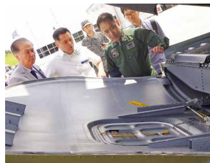
H30.4.5 自衛隊ヘリ機体一部落下事故に関する要請

県としましては、エリア拡張の必要性など同空港の将来のあり方について国や経済界と議論を重ねつつ、那覇空港の機能強化に取り組んでまいります。