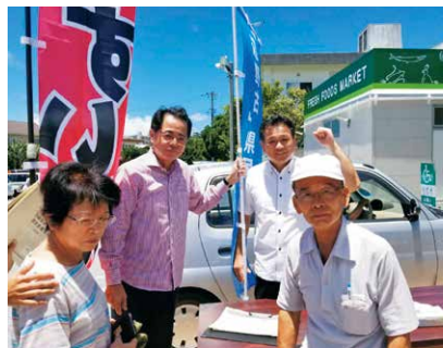
H30.7.6 県民投票署名活動