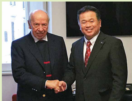
1月14日 イタリア元首相ディーニ氏

議会の最終的な意思は本会議で決定されますが、今日のように社会が複雑多岐になると、本会議での能率的な審議は困難になるので、専門的、効率的に審査するため、議会の内部組織として委員会が置かれています。