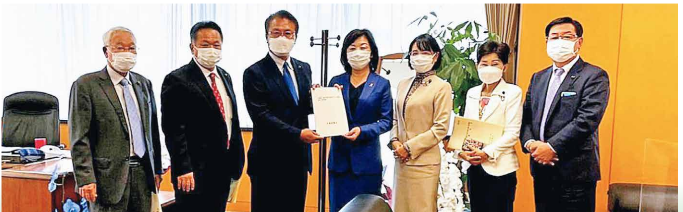
野田聖子 地方創生担当大臣 要請 11月5日(金) 超党派でコロナ・軽石に係る、地方創生臨時交付金増額を含む必要な財源措置を求める。

そのため、私は主役である県民の皆様と情報を共有し、議会や行政の改革で前例主義を打破して「県民の命と暮らしを守る」施策に全力で取り組んでいくことをお約束いたします。