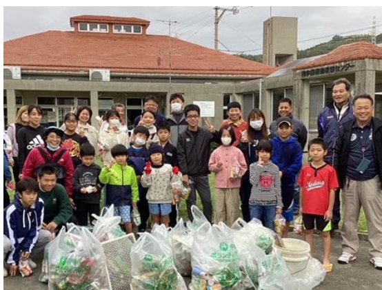
御万人すりてい CGG 運動 和宇慶公民館